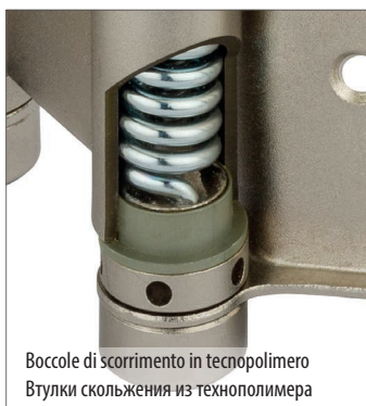
Boccole di scorrimento in tecnopolimero Втулки скольжения из технополимера