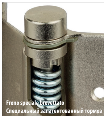
Freno speciale brevettato Специальный запатентованный тормоз