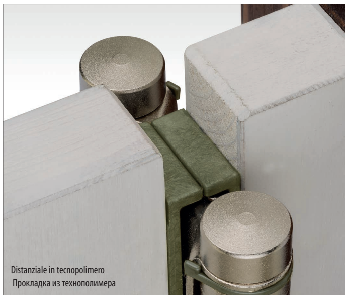
Distanziale in tecnopolimero Прокладка из технополимера

Исходные характеристики этих полимеров остаются неизменными со временем, даже без необходимости смазки или технического обслуживания.